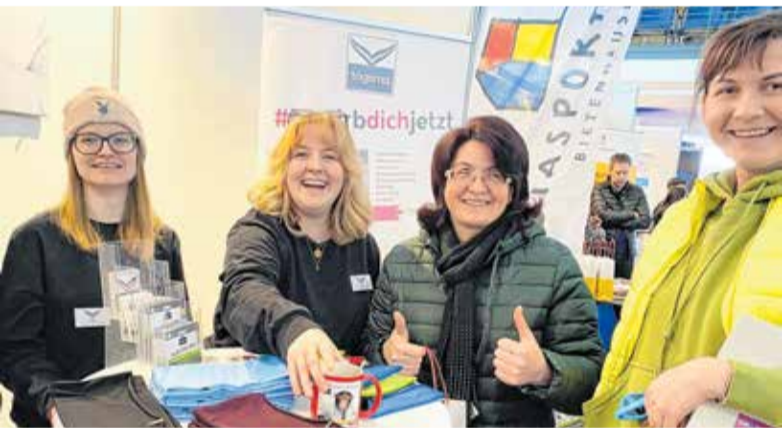
Die CHANCE! bringt junge Talente und Unternehmen zusammen und schafft echte Perspektiven.