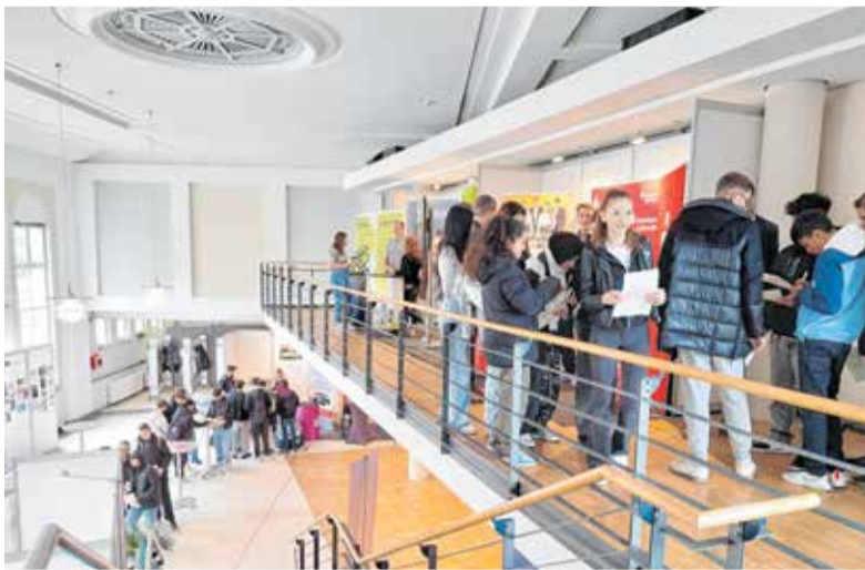
Das Angebot der regionalen Unternehmen stößt auf großes Interesse bei den Schülern. An vielen Messeständen gibt es einen Einblick in die praktische Arbeit.